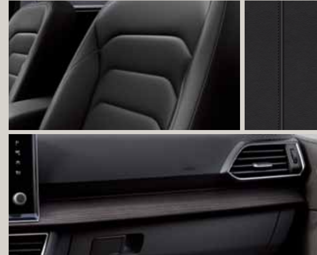
Pell negra Vienna