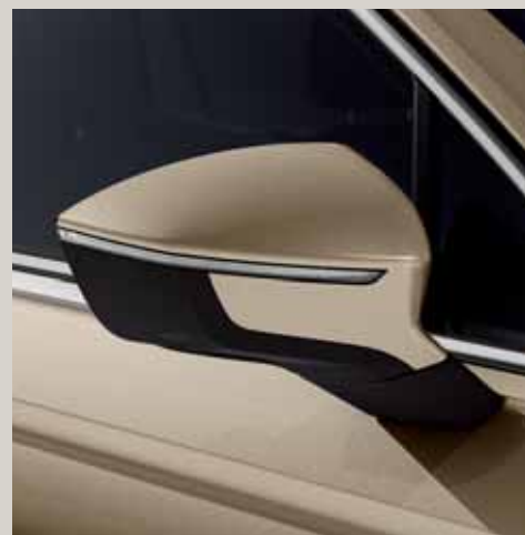
Beix Titanium** St XE