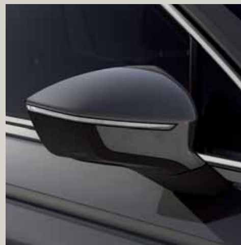
Gris Urano* St XE