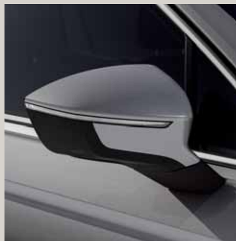
Plata Reflex** St XE