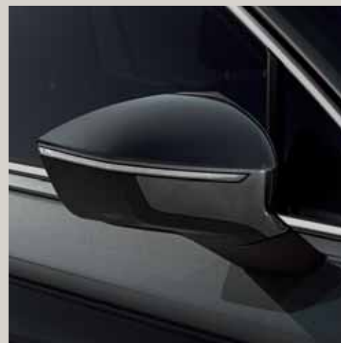
Dark Camouflage*** St XE