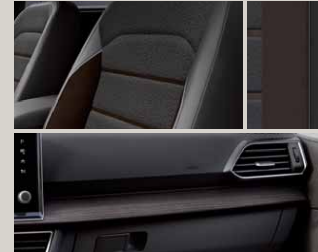
Tela Baza amb insercions laterals en Alcantara® marró / PVC Bisó