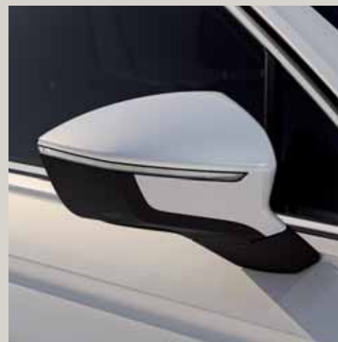
Blanc Oryx*** St XE