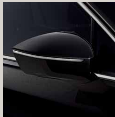
Black Deep** St XE

Style St Xcellence XE De sèrie ■ Opcional ■ *Suau. **Metal·litzat. ***Exclusiu.