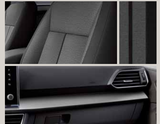
Tela Olot amb insercions negres en Alcantara®