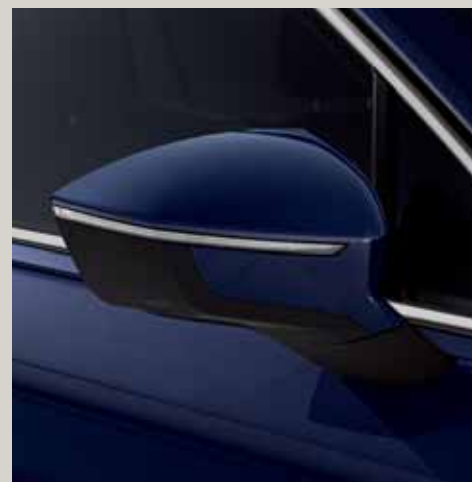
Blau Atlantic** St XE