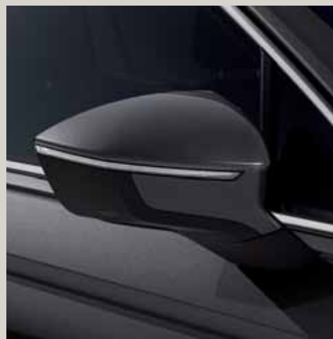
Gris Indium** St XE